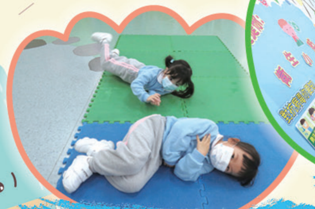
體能活動時，與同伴一起 向前滾動身體。