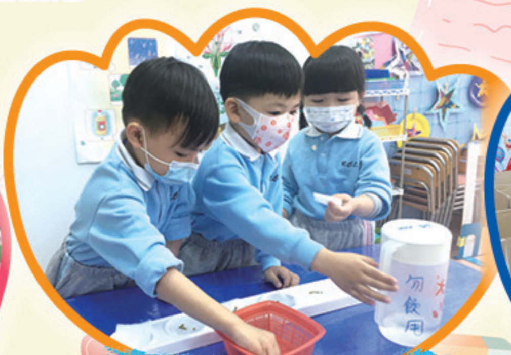
一起享受種植的樂趣。