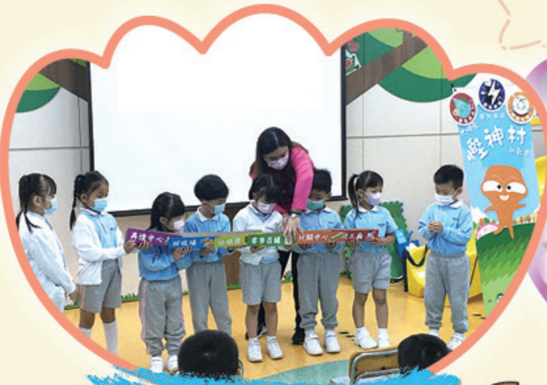
愛護地球，我做得好。