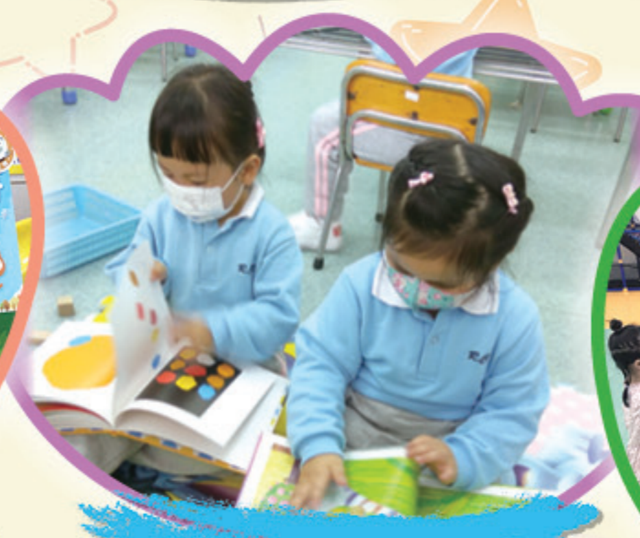
我喜歡與同伴一起看圖書。