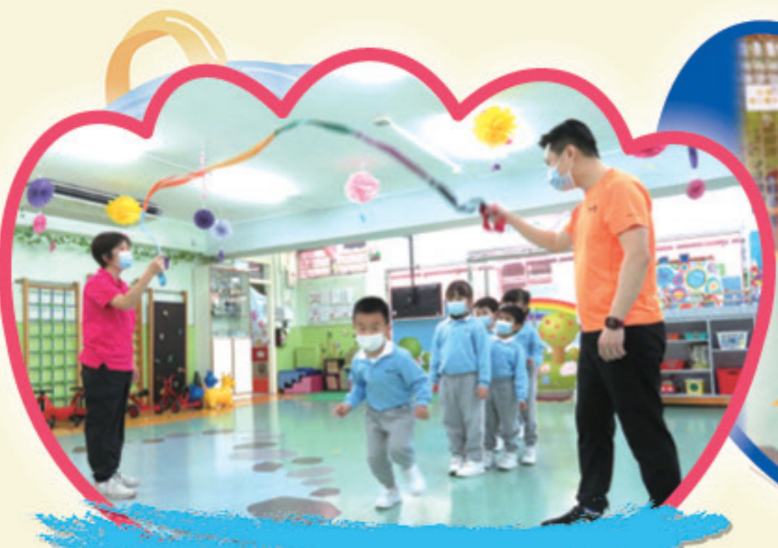
看清楚前方後，1,2,3衝過去。