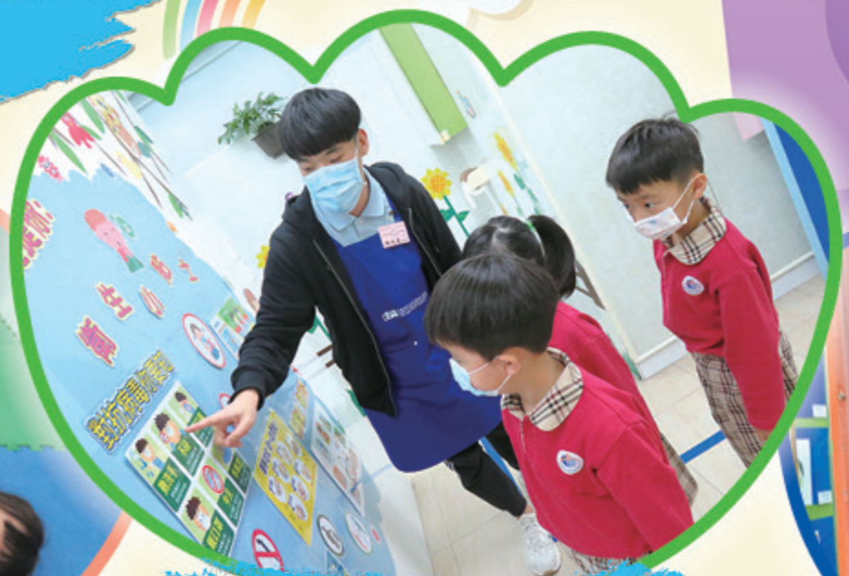
我們也要謹記防疫小貼士呢！