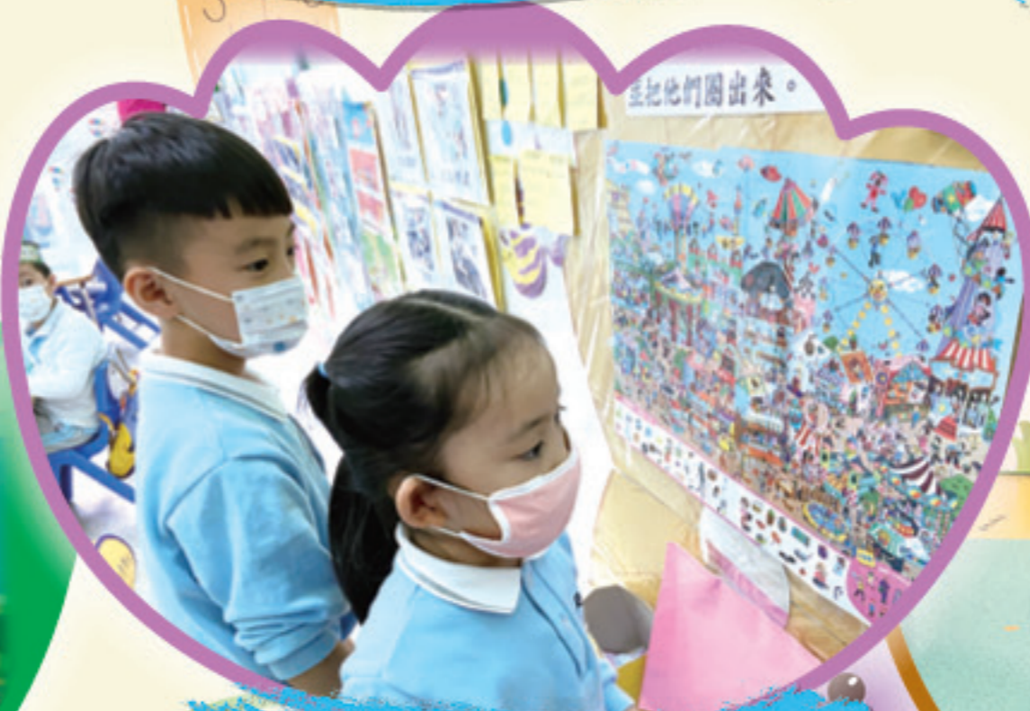
你看到這個人藏在哪裡嗎？