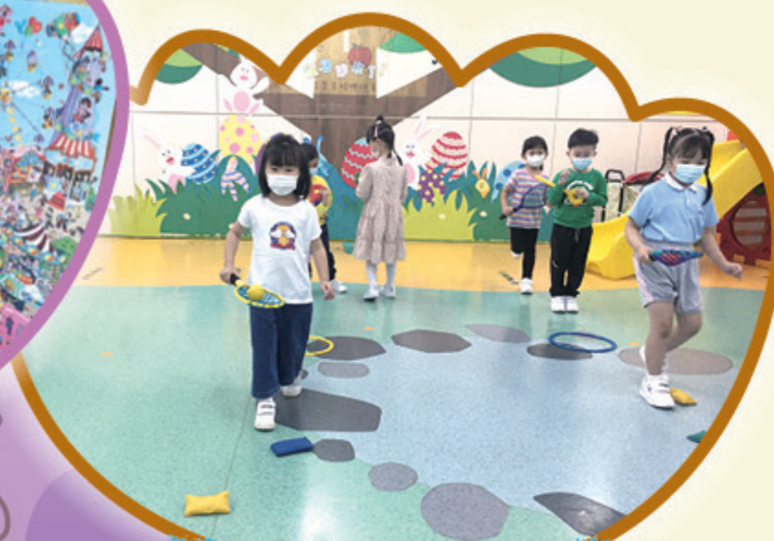
小棉球，你不要掉下來。