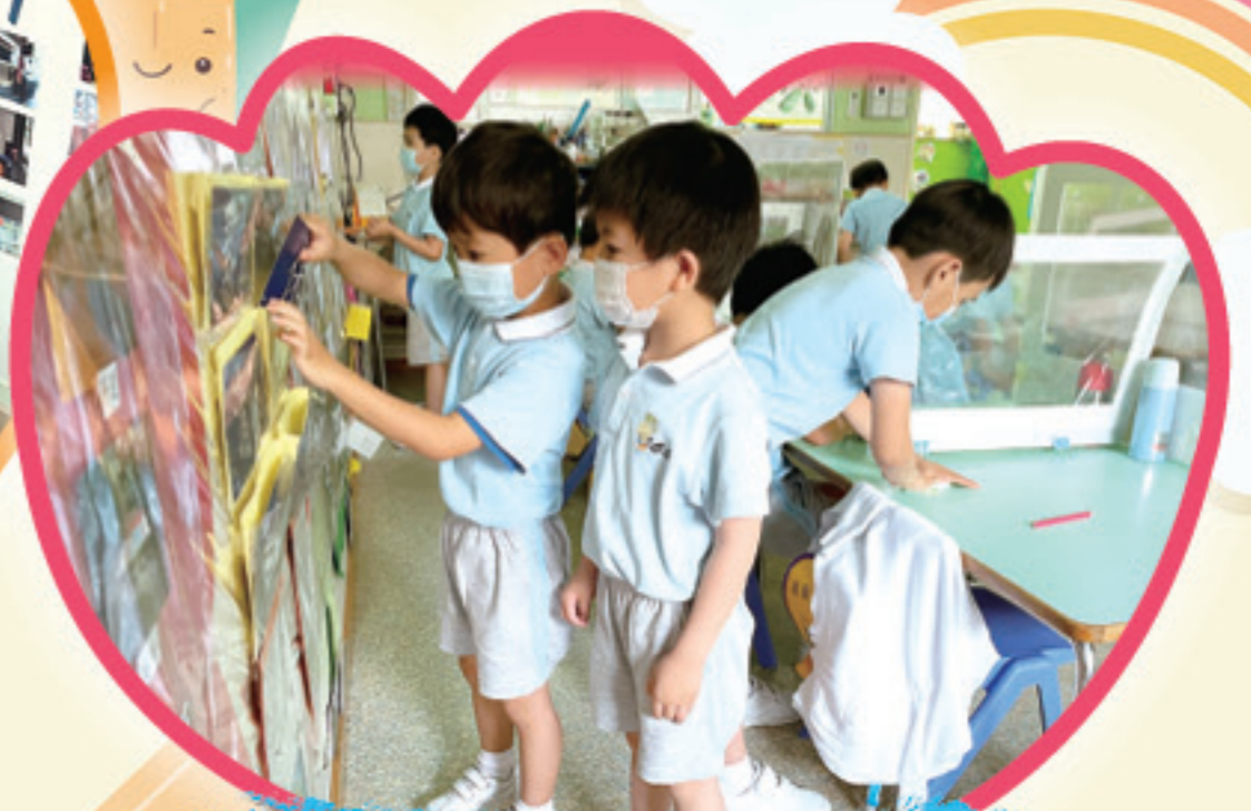
齊齊認讀中文生字。