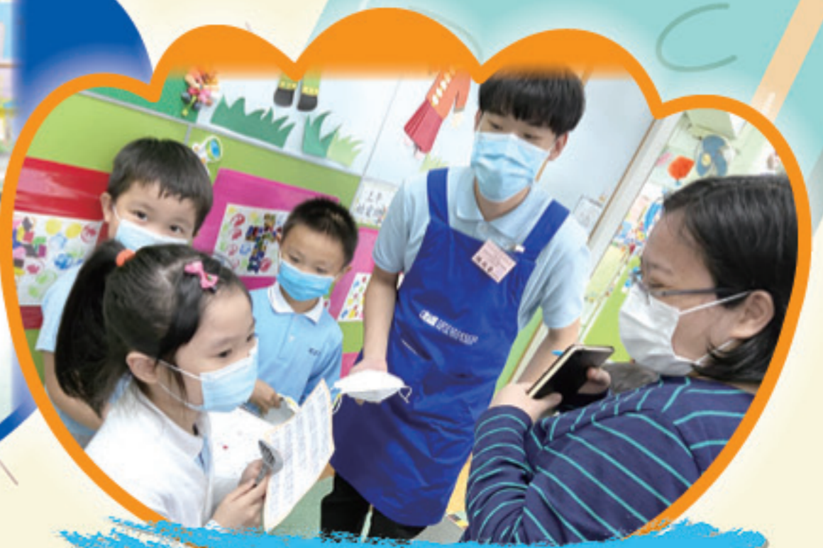
校長，請問你可接受我們的訪問嗎？