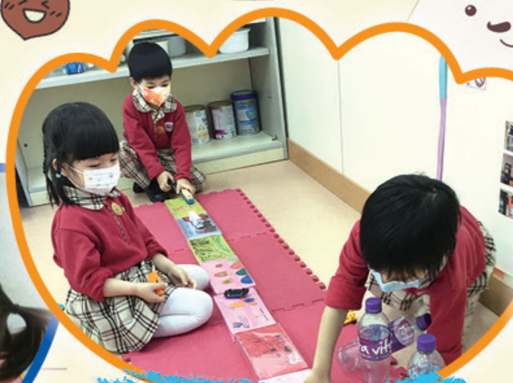
我們齊來開著汽車向前走。