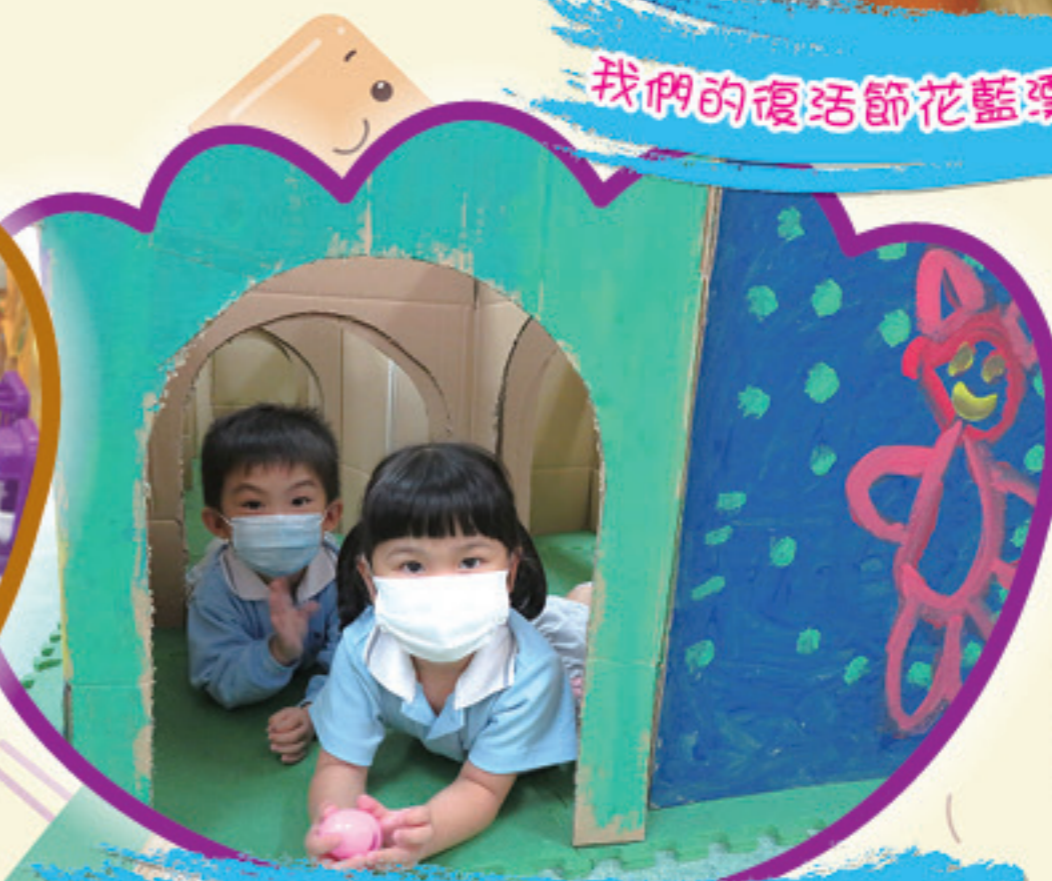
與同伴在紙箱迷宮尋找復活蛋。