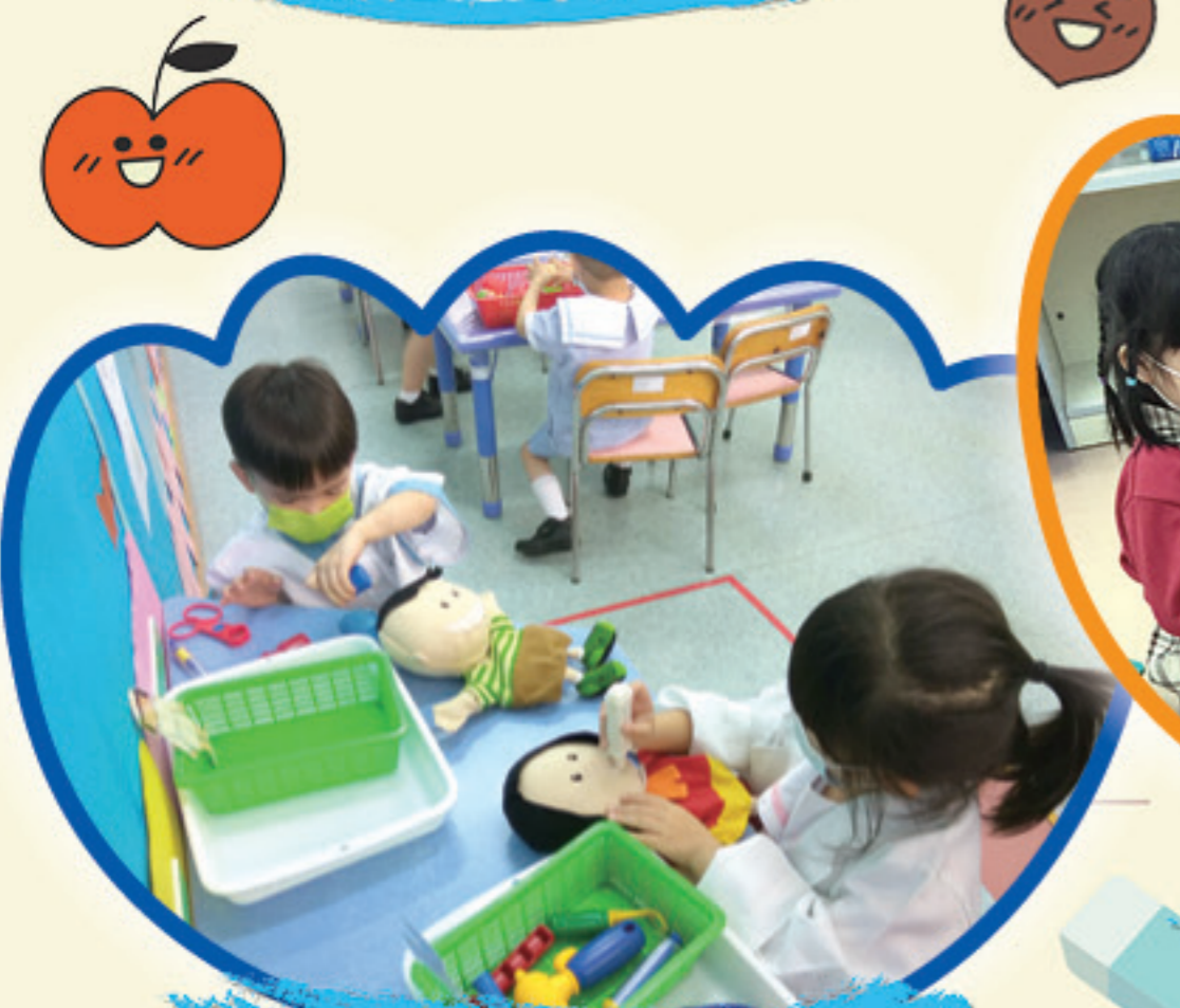
我與同伴一起扮演醫生和護士。