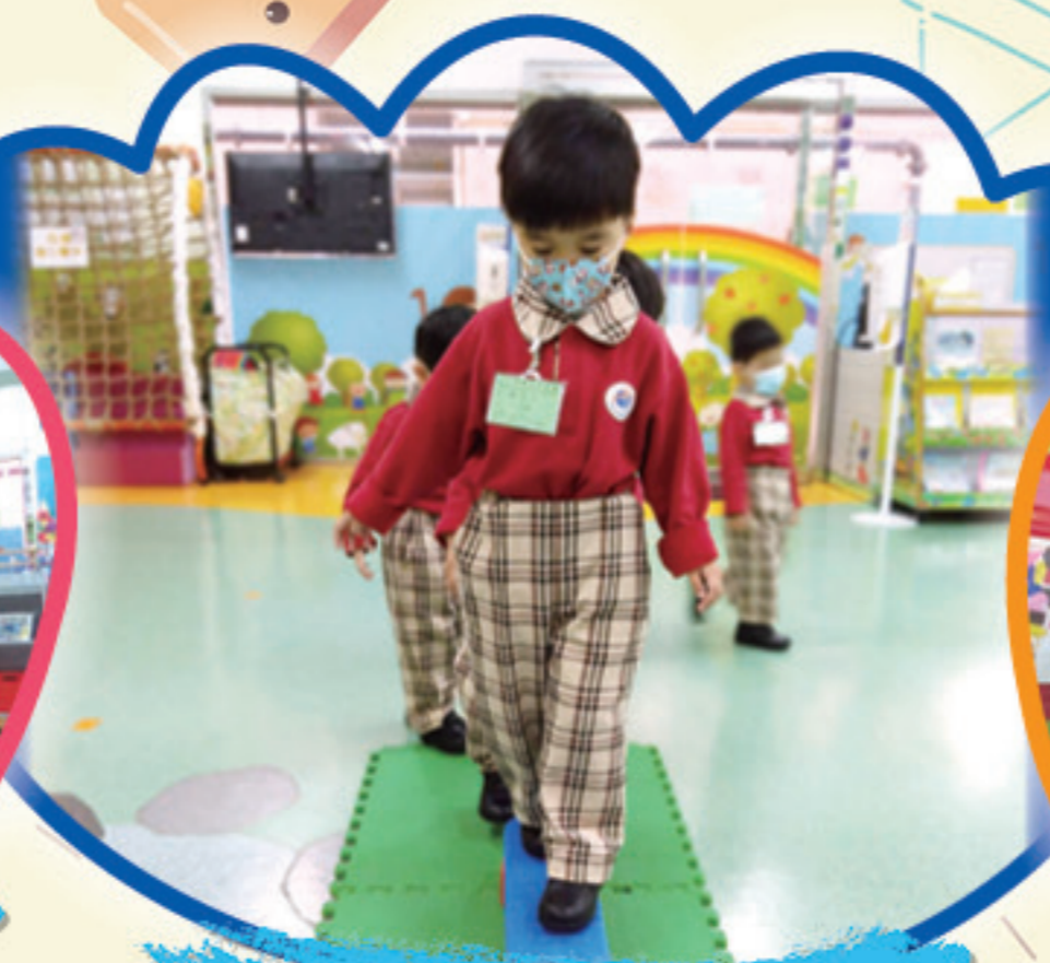
我們穩定地行上平衡木。