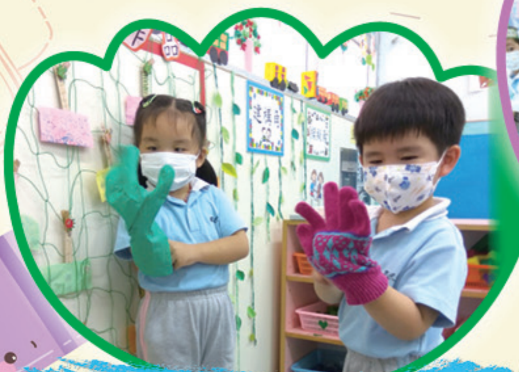
我們進行乾強小實驗。