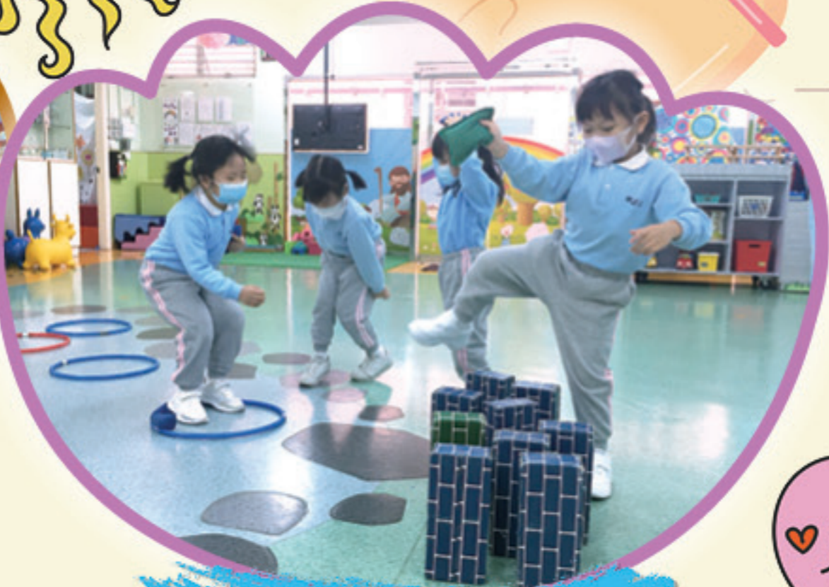
讓我想想跨過紙磚的方法。