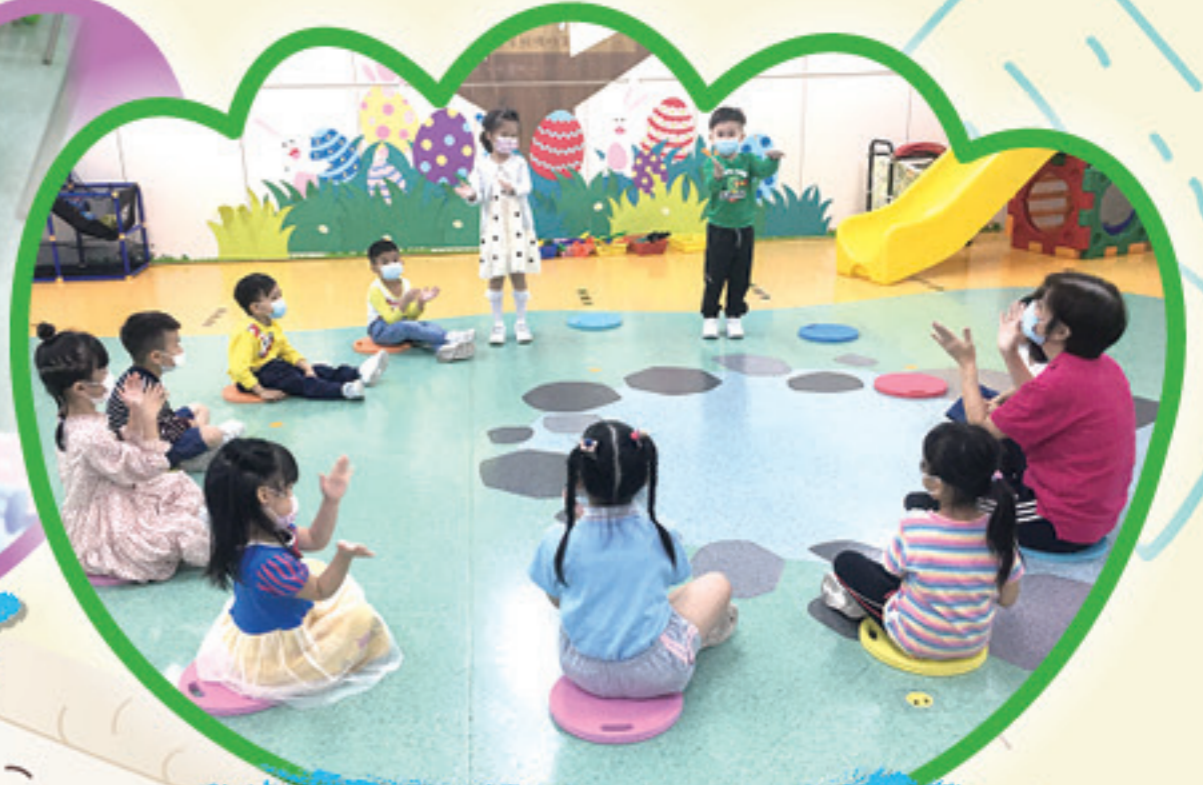
跟著我們拍拍手做動作。