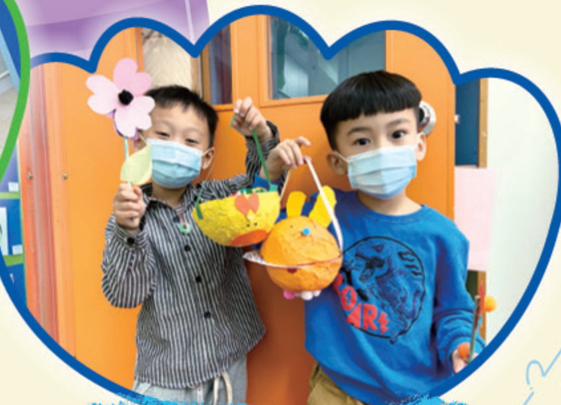
我們的復活節花籃漂亮嗎？