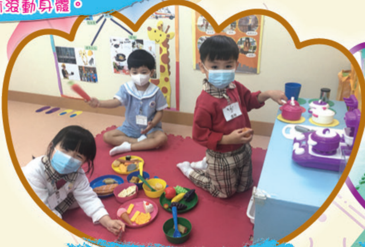
我為客人製作美味食物。