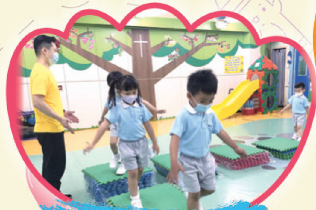
一步踏前，小心地過橋。

在疫境中，師生們更珍惜面授課的日子，老師以生動活潑的方式進行教學，孩子們亦認真地進行不同的學習活動，齊享愉快的校園生活。