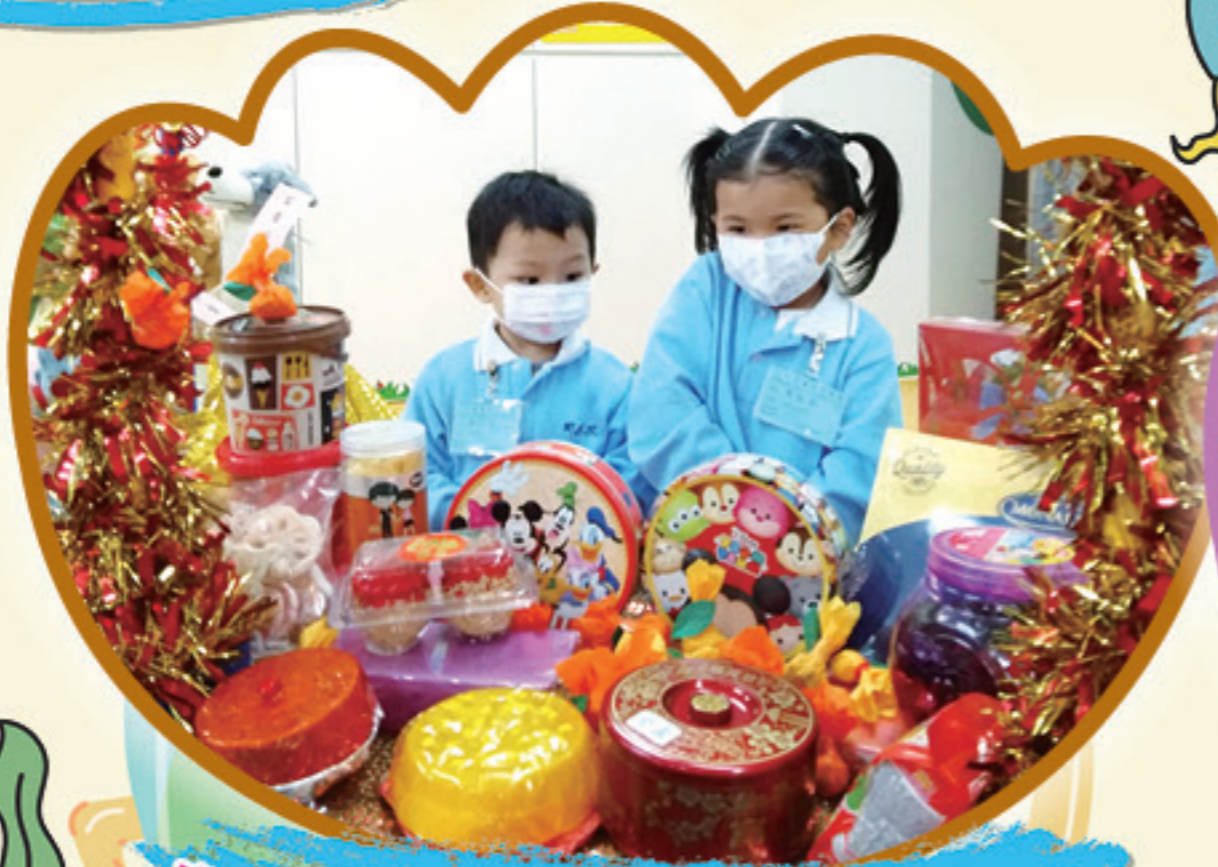
我們就是甜蜜樂園攤位的「小老闆」， 買美味的糖果回家啦！