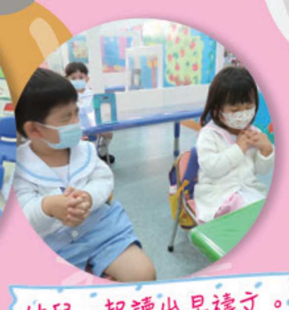
幼兒一起讀出早禱文。