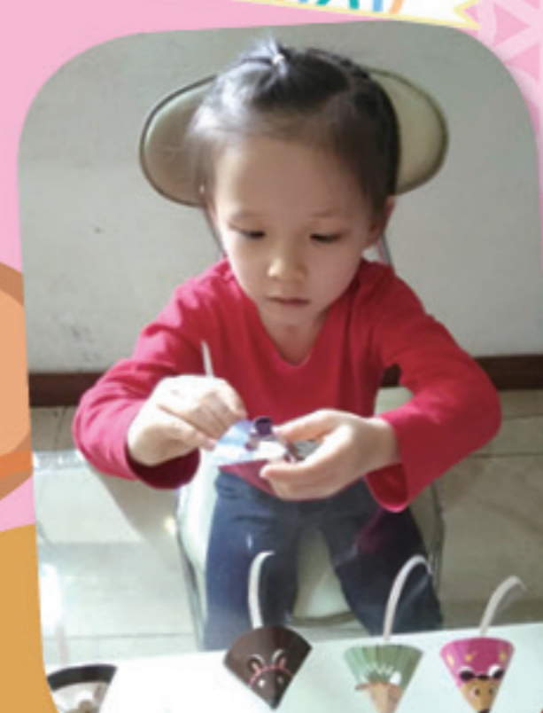
看！我的老鼠多可愛。