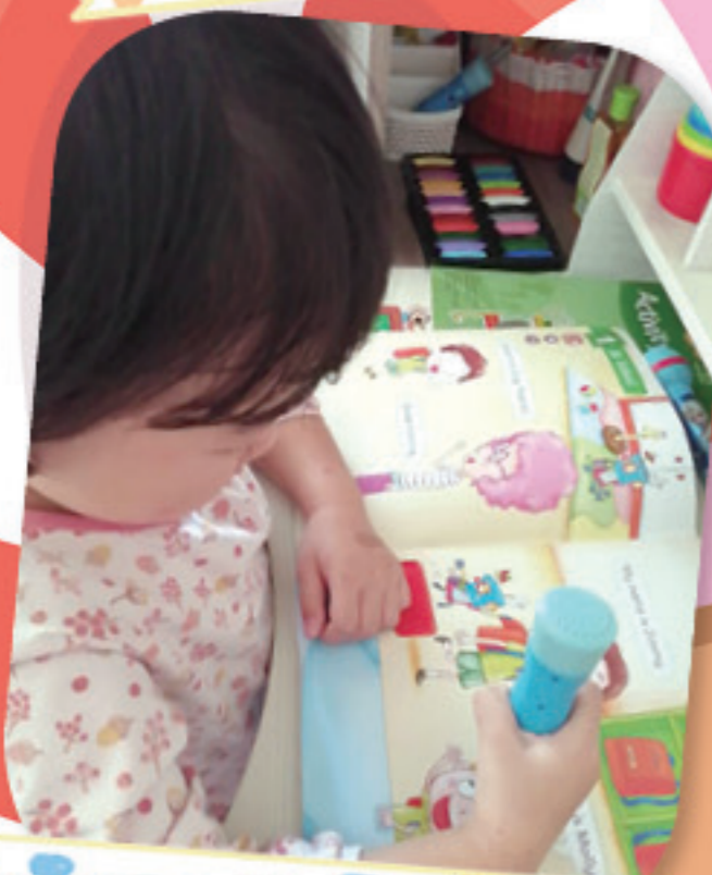
我在家也會認真地學習英文。