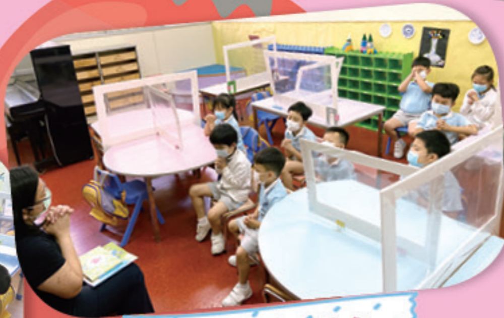
我們一起唸主禱文。