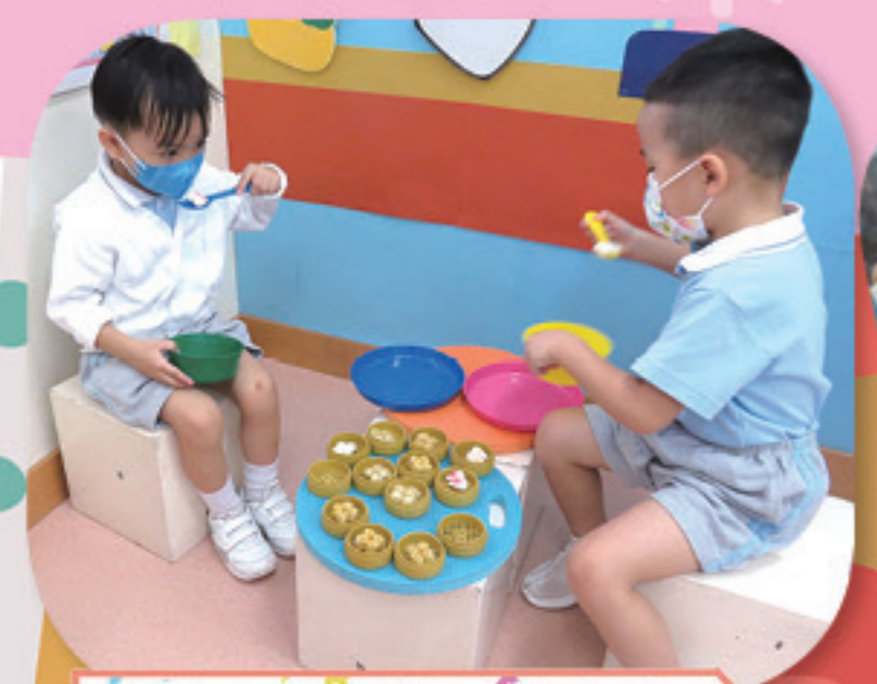
點心真好吃，你也來吃一口。