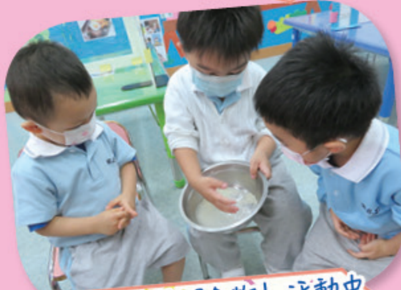
幼兒在主題「食物」活動中學習洗米。