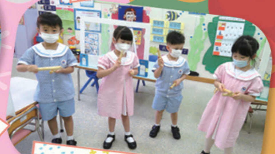
響木的聲音真好聽啊！