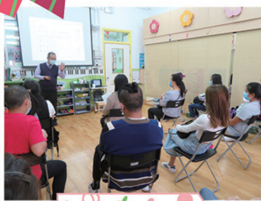
11月13日 「處理孩子的雙贏之道」