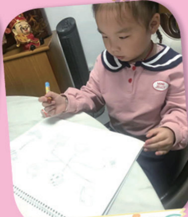
我在家進行視覺空間小任務。