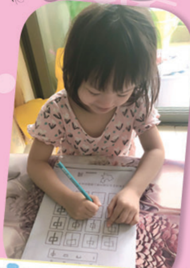
你看，我會執筆寫字了！