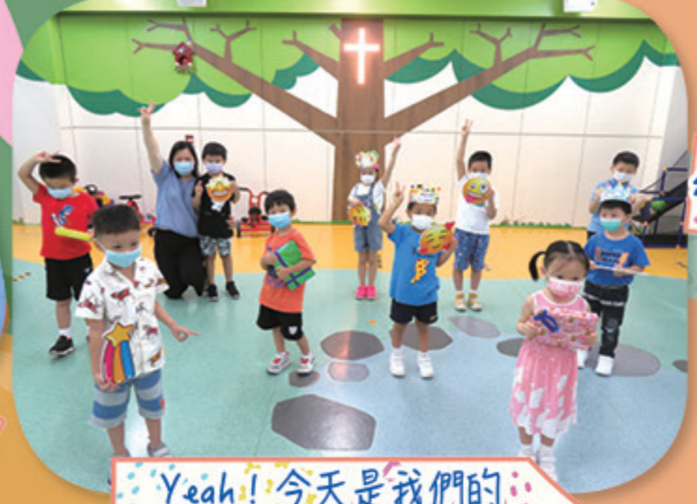
Yeah! 今天我們的生日會。