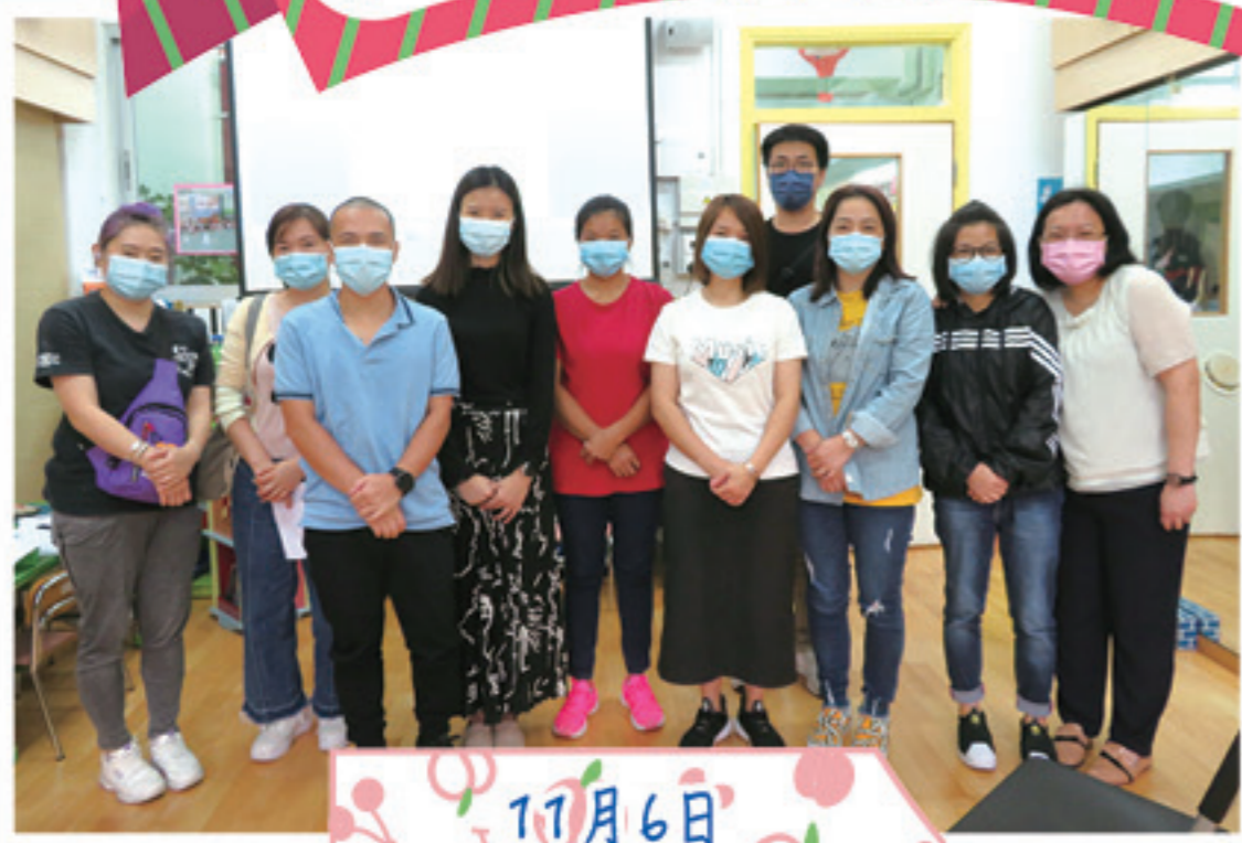
11月6日 「父母同心管教」