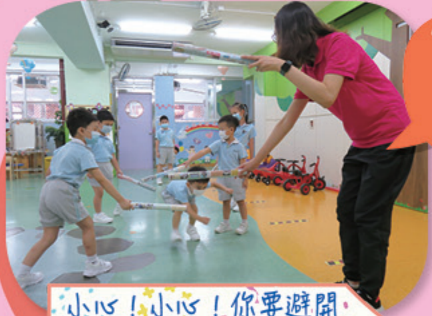
小心！小心！你要避開我們的障礙物。