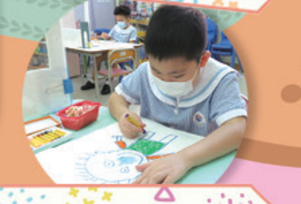
我的自畫像畫得神似嗎？