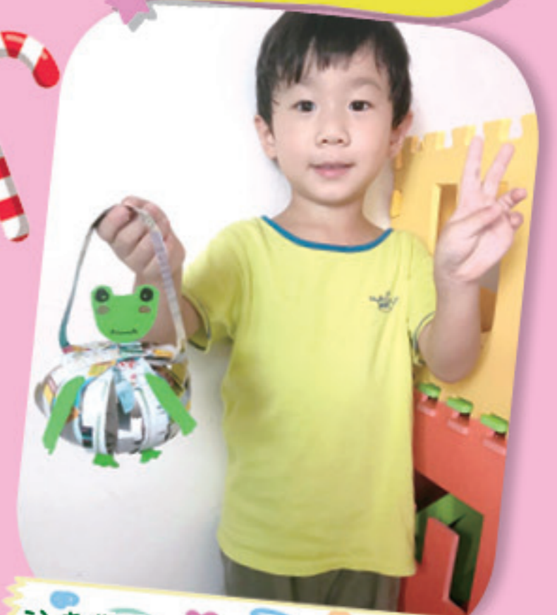
我喜歡和媽媽一起做燈籠！