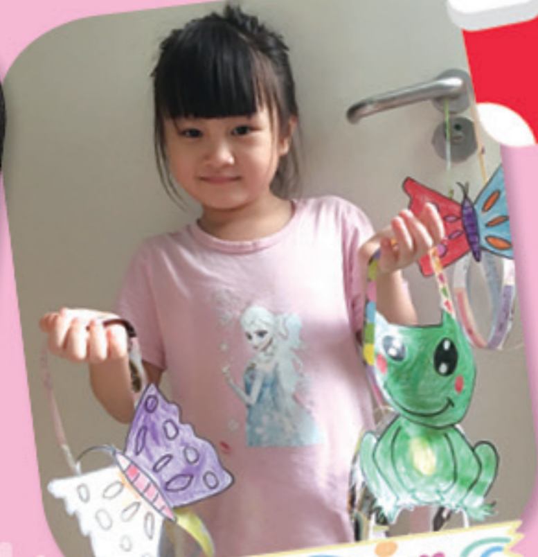
我會和弟弟一起玩燈籠。