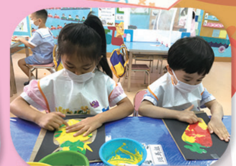
我們用手指把顏色推開，變成七彩繽紛的蔬果。