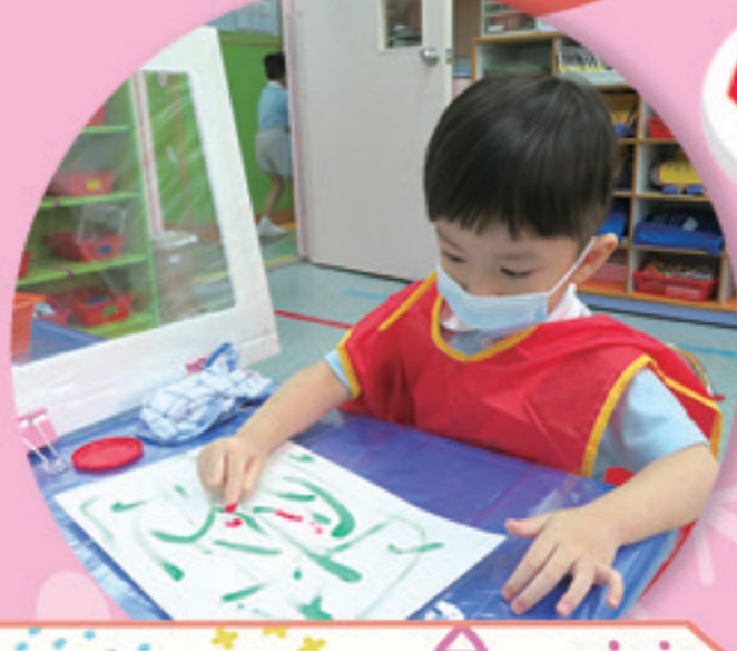
幼兒利用手指製作手指畫。