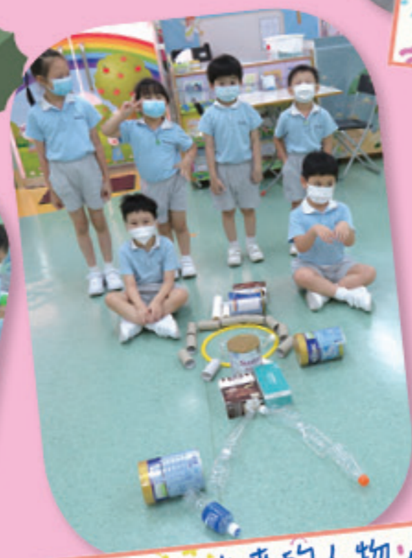
我們拼砌出來的人物，多麼有創意！