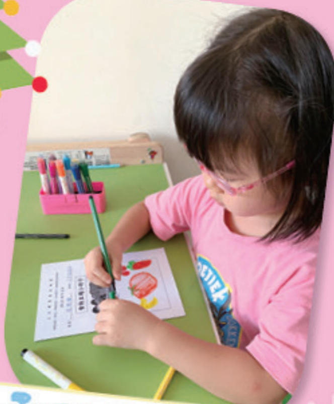
我把喜歡的食物畫出來。