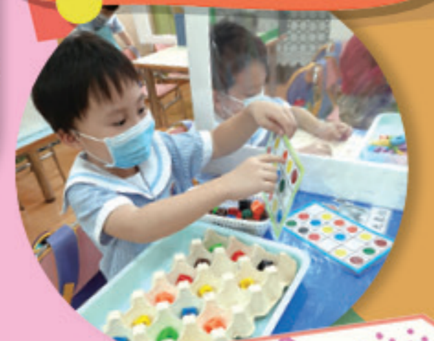
我也懂得跟顏色指示排列數粒。