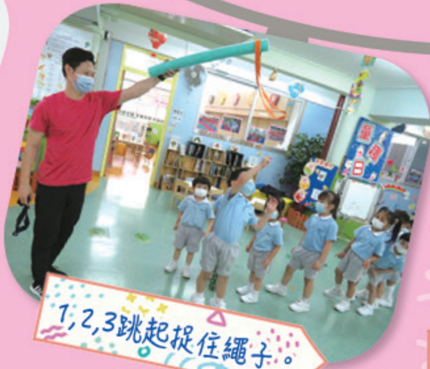
1, 2, 3 跳起捉住繩子。