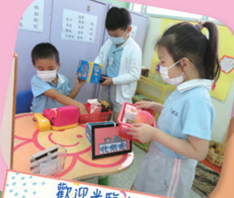
歡迎光臨！請問想買甚麼呢？