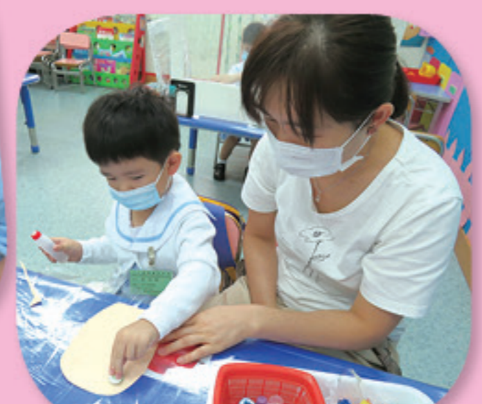
家長與幼兒製作拼貼面譜。