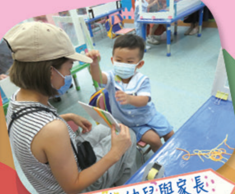
「迎新日」幼兒與家長一起做繞線活動。