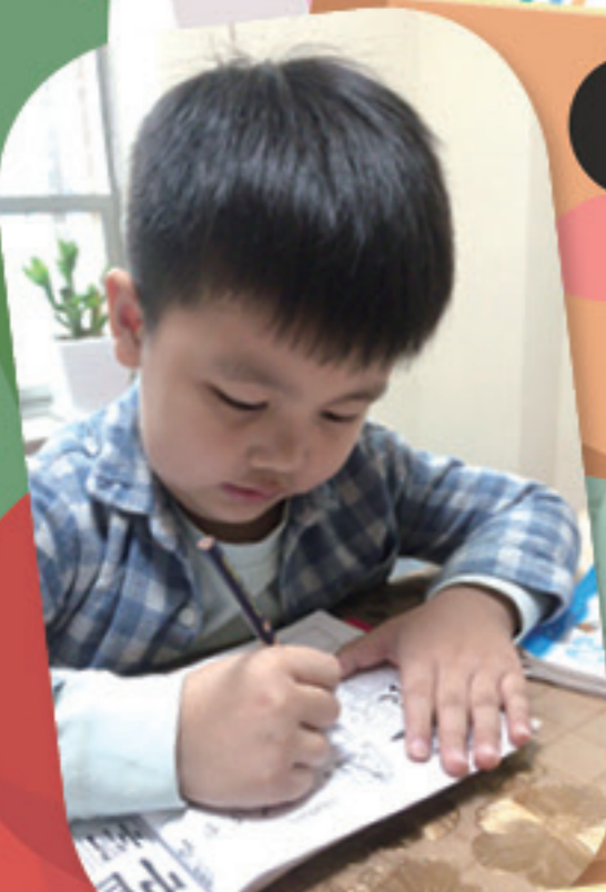
我的字寫得漂亮嗎？