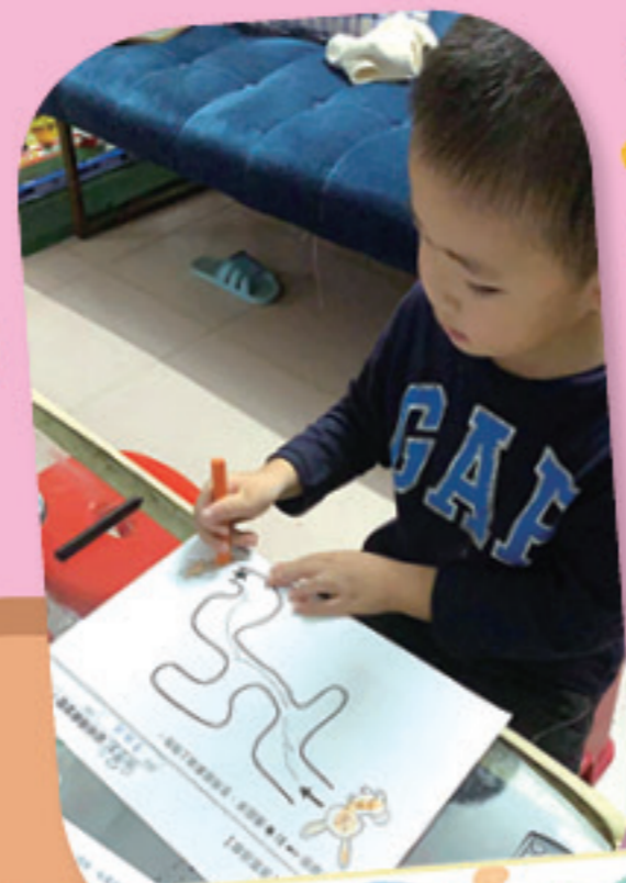
幼兒畫簡單的迷宮遊戲。