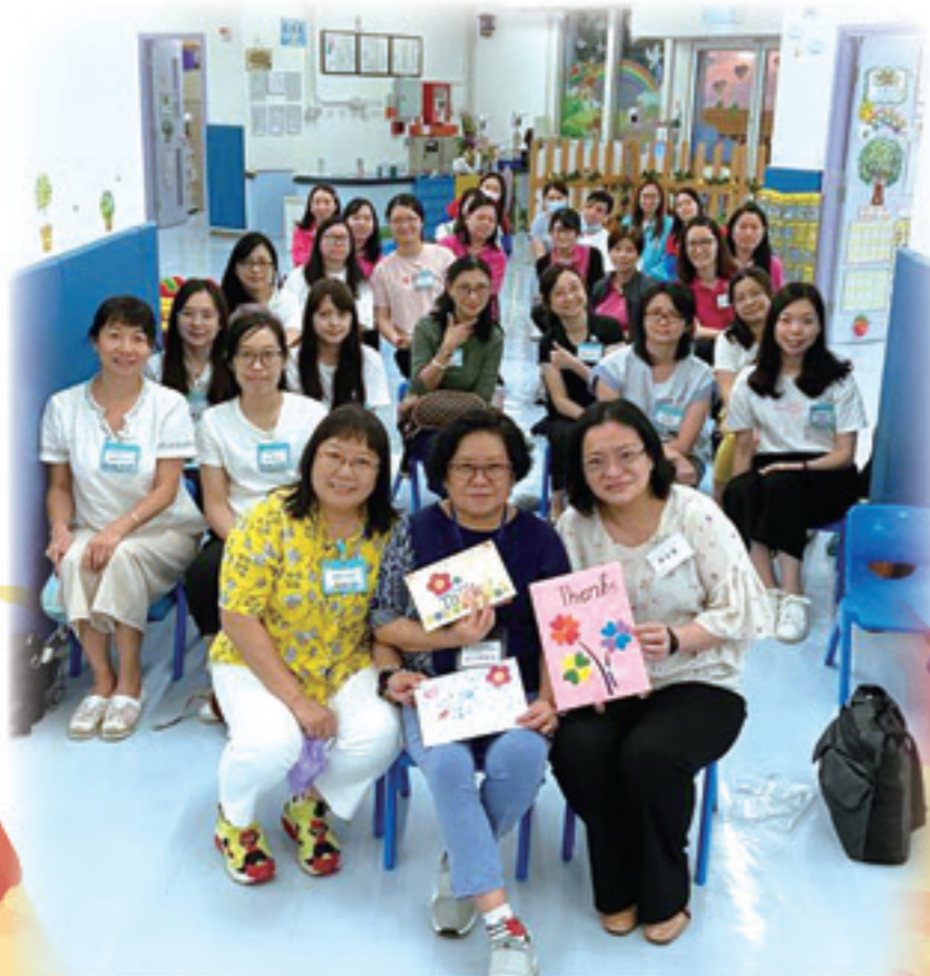
到港青基信幼稚園（啟晴）參觀，交流後校長和老師們一起拍大合照。

為致力提升團隊的教學質素和默契，分別於9月15日到港青基信幼稚園（啟晴）參觀交流，在9月30日教師培訓日舉辦由匡智會導師主講的「小小空間也可玩大肌肉遊戲」工作坊，以提升教師帶領自由遊戲的技巧；是日下午更藉教師團隊活動(Circle Painting)加強彼此間的默契，更學習把當天的分享應用到教學上。