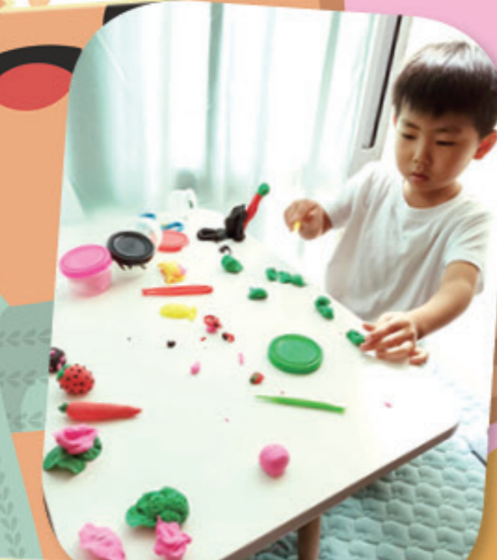
泥膠可做各式各樣的食物呢！