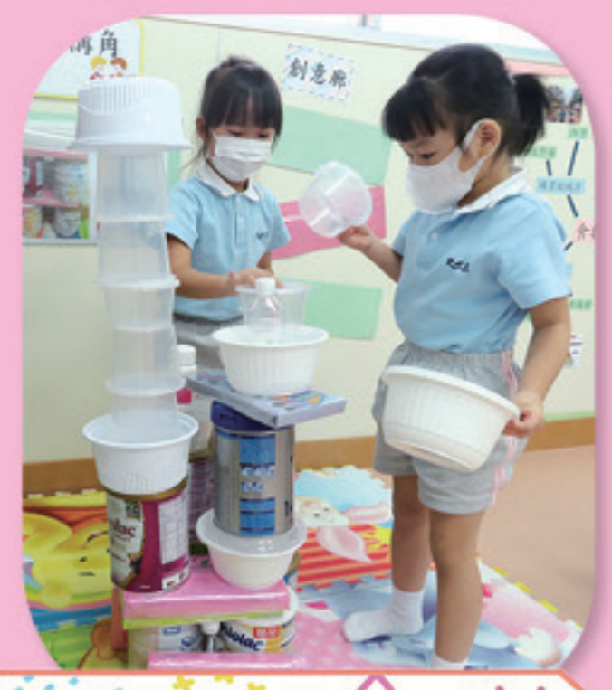
我們一起堆砌出高樓大廈。