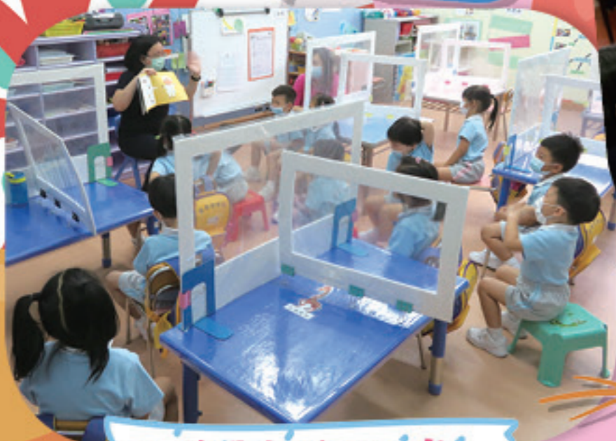
校長和我們分享品格故事「仁愛」。