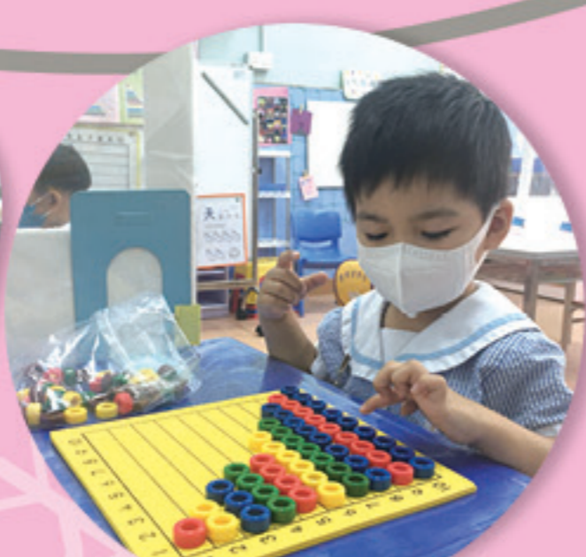
我會再檢查1-10的數學排列。