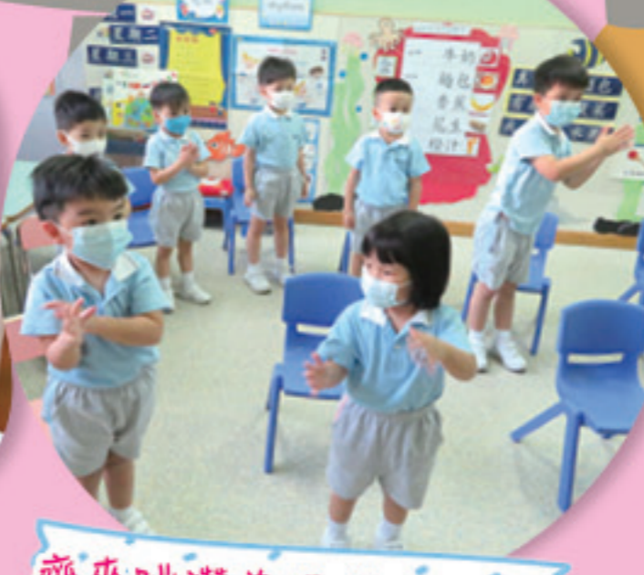
齊來跳讚美操讚美上帝。