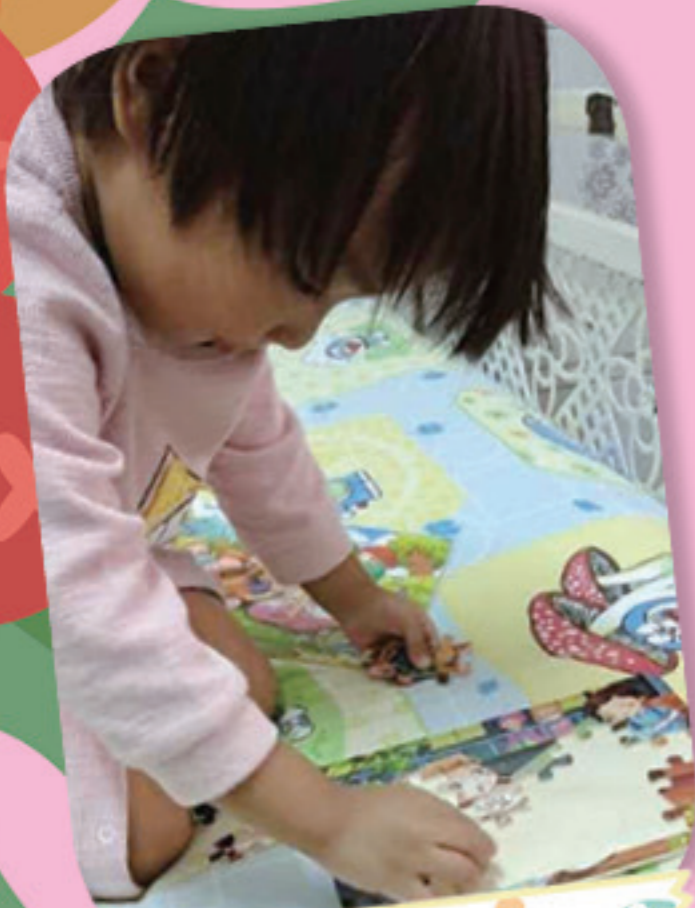
幼兒在家學習多於八塊的拼圖遊戲。