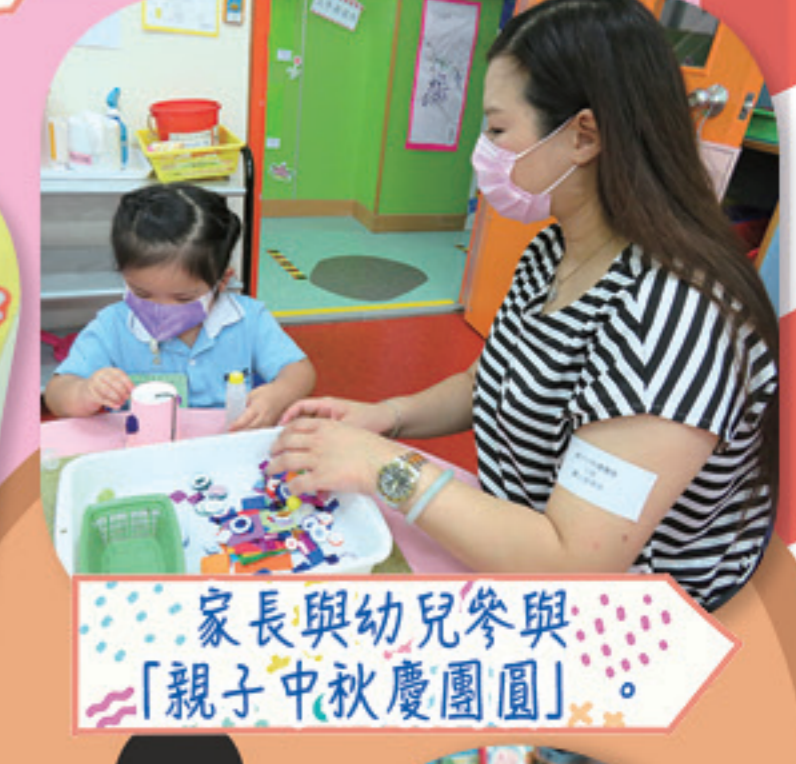
家長與幼兒參與「親子中秋慶團圓」。