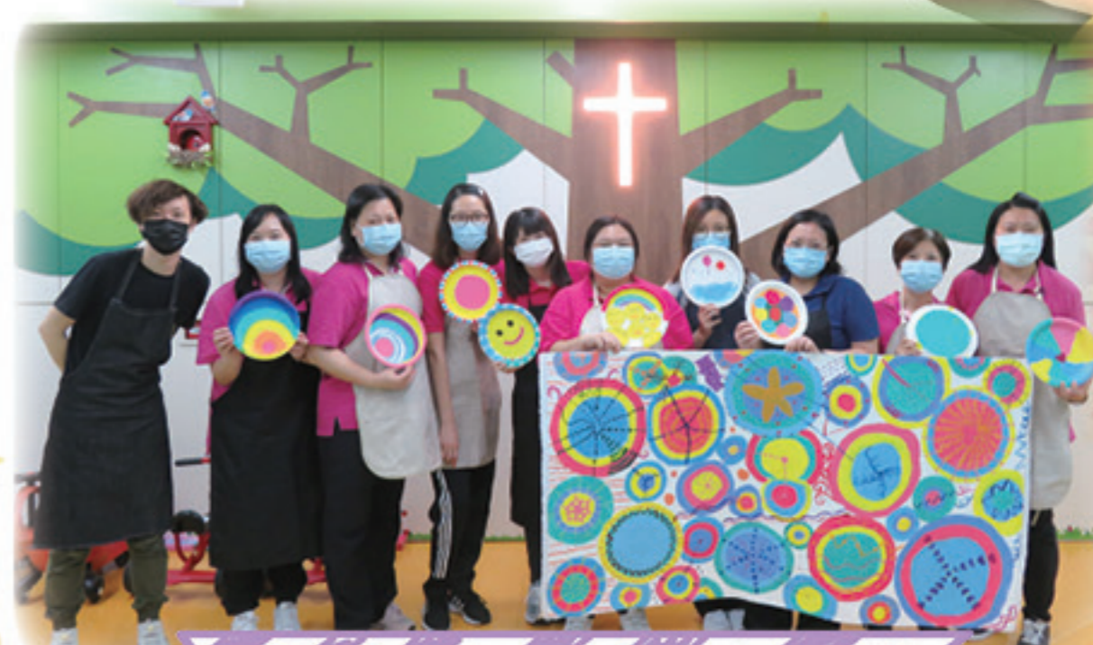
一個個緊貼的圓圈代表著無限創意，也是團隊成員彼此的依靠扶持。