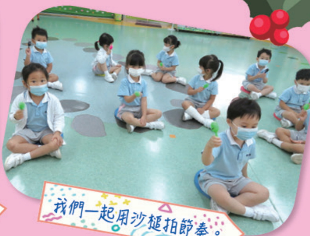
我們一起用沙槌拍節奏。