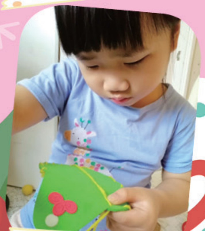
繩子穿過去，小袋子就快完成了！