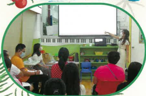
親子對話式閱讀講座