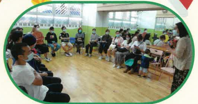
幼兒正向管教工作坊