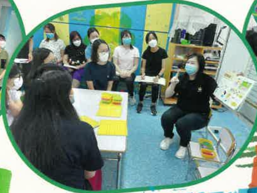
「操作式數學」培訓，透過教學示範，一起動手做、齊齊學，互相交流。