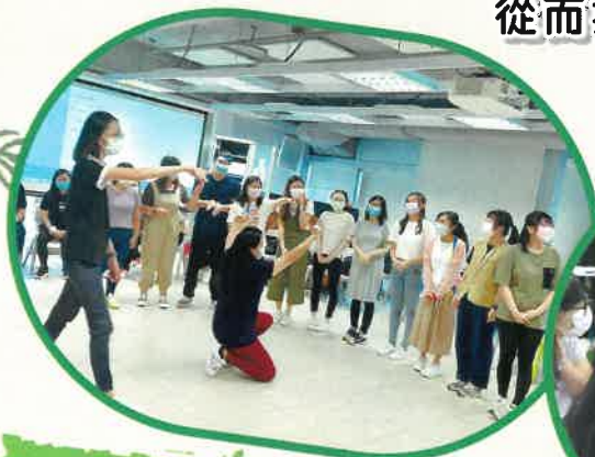
透過遊戲讓參與者體驗9個品格果子的特質。