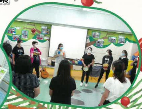
透過不同音樂遊戲，讓老師們能輕鬆減壓。