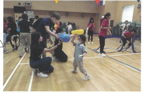
遊戲三：親子火箭發射