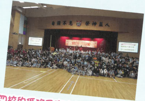
四校的低班及高班學生家長大合照