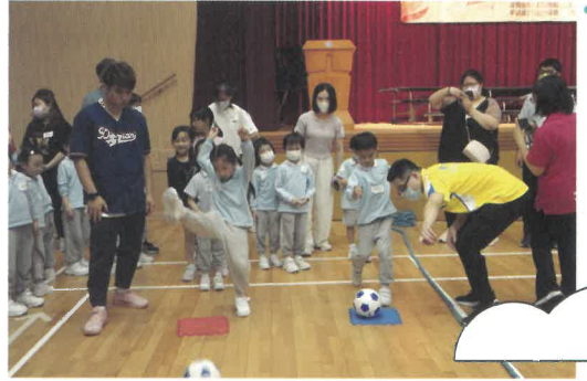
遊戲四：考考你的身體協調