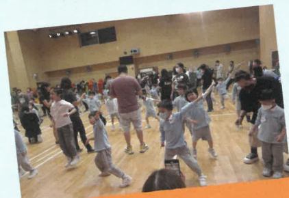
低班集體親子舞蹈