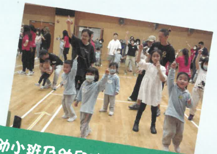
幼小班及幼兒班集體親子舞蹈