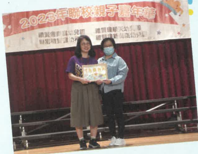
區少群校董頒贈感謝狀予 基慈小學借出場地