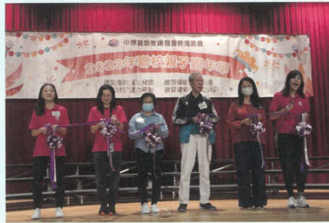
區少群校董、基永敏校董、基芝潔總主任 與校長們主持開幕儀式一起剪綵