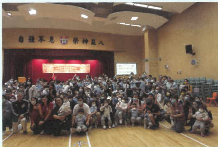
禮賢會順天幼兒園及禮賢會新蒲崗 幼兒園低班及高班合照