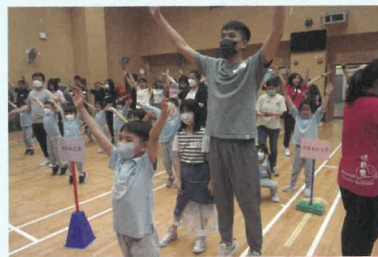
高班集體親子舞蹈