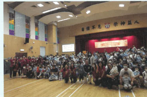
禮賢會樂富幼兒園的小班學生家長及 樂富禮賢會幼稚園幼兒班學生家長合照