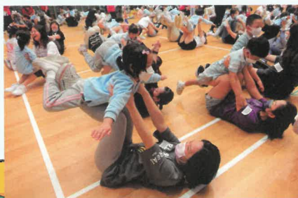
親子合作性體能遊戲