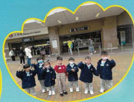
幼兒班第一次出外參觀，我們一起到上水港鐵站。