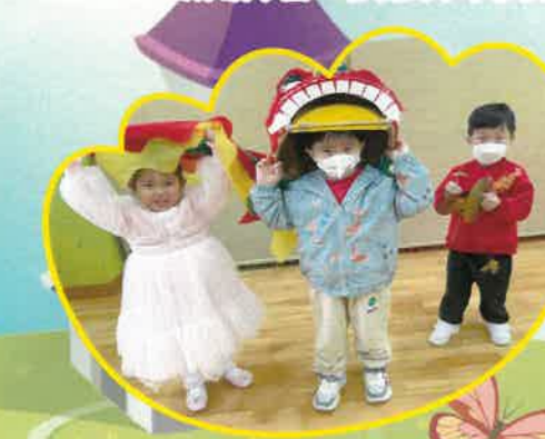
新年到，我們一起來玩舞獅。