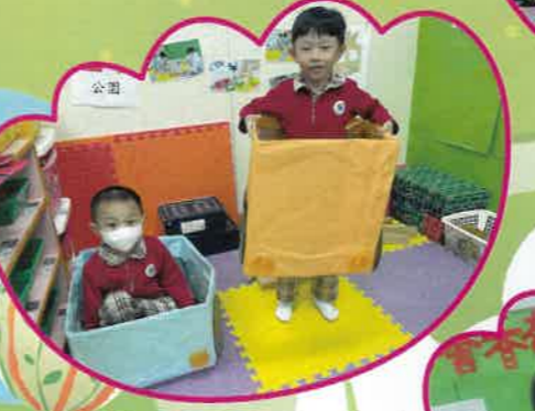
啵啵啵，大巴士開車了！