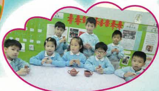
中華文化週，我們體驗泡茶，品茶的樂趣。