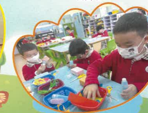
自選活動時間，我們正在製作交通工具。