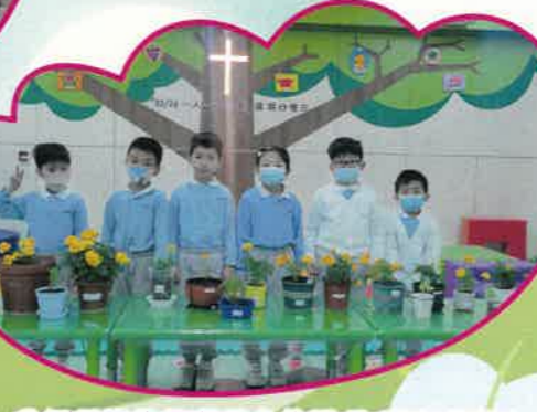
我們種植的萬壽菊多美麗呀！要有責任心、愛心和耐性，才能陪伴小植物成長。