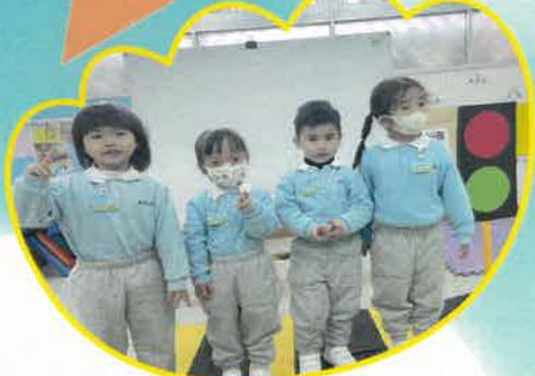
一二三紅綠燈，過馬路要小心！