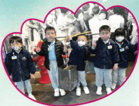
在水知園，我們學習到珍惜用水的重要性。