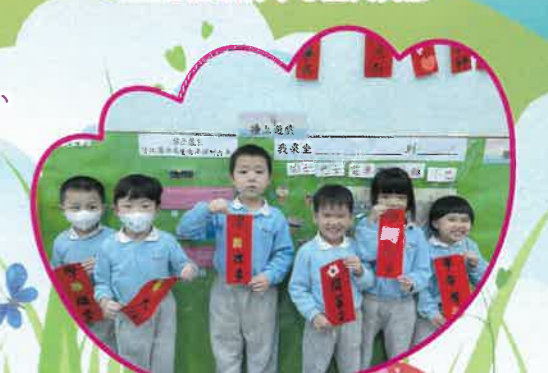
新年到，我們學習寫揮春。