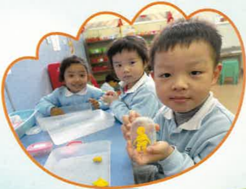
我們一起製作麵粉公仔，認識中華文化藝術。