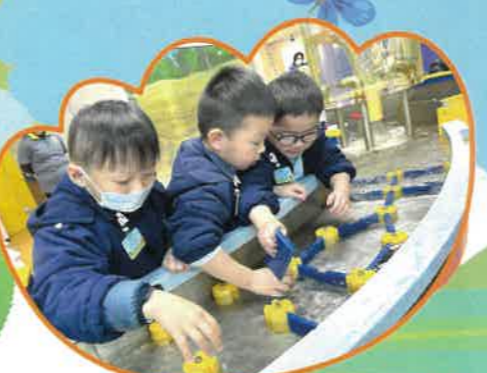
我們在水知園探索水的特性。