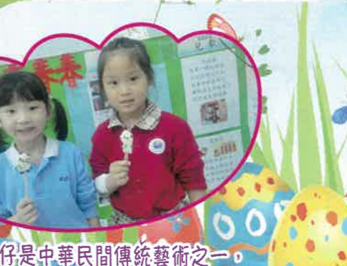
麵粉公仔是中華民間傳統藝術之一，我們當麵粉公仔師傅搓出小熊貓。