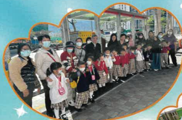
透過親子巴士遊活動，我們認識到巴士上的設施和標誌。