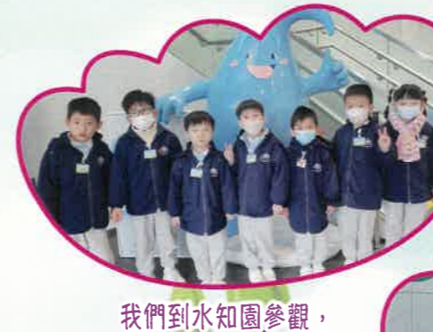
我們到水知園參觀，加強對保護水資源的意識。