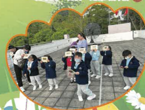
我們正在以特別的工具觀察太陽，在可觀自然教育中心學習到很多天文知識。