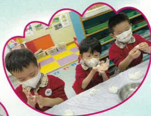
我們一起來動手搓湯圓。