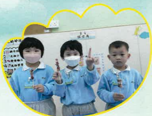
我們自己做的冰糖水果串真好吃！