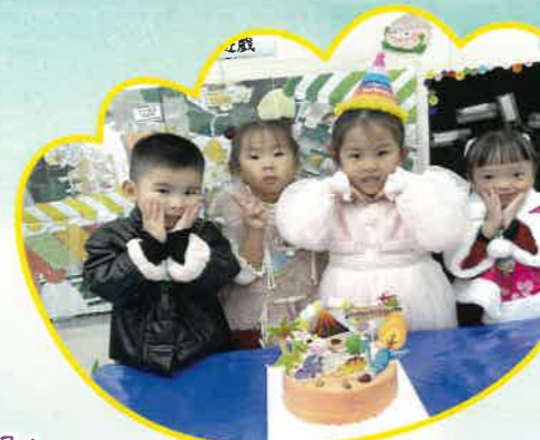
我們跟生日之星一同慶祝生日，真開心！