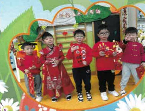
我們穿著帥氣的華服，一起慶祝農曆新年。