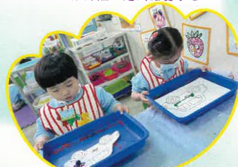
我們正在製作波子畫，看我的車子多美呢！