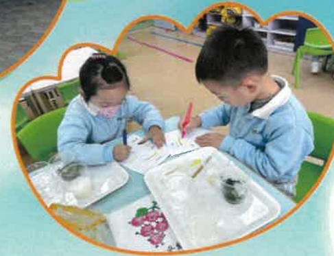
進行溶解實驗後，我們在記錄結果。