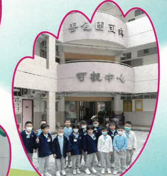
我們一起參觀可觀自然教育中心暨天文館。